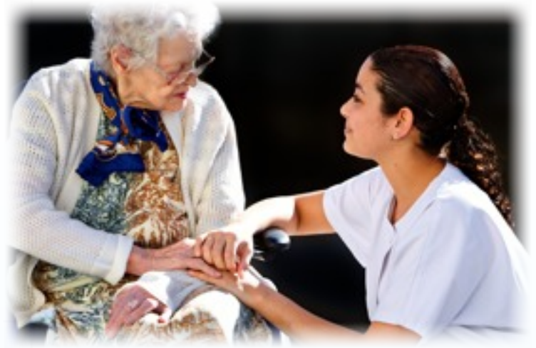
Orfidée a développé une solution de géolocalisation pour le monde de la santé

Grâce à la RFID active, géolocalisez en intérieur les biens ou les personnes en établissements de santé.